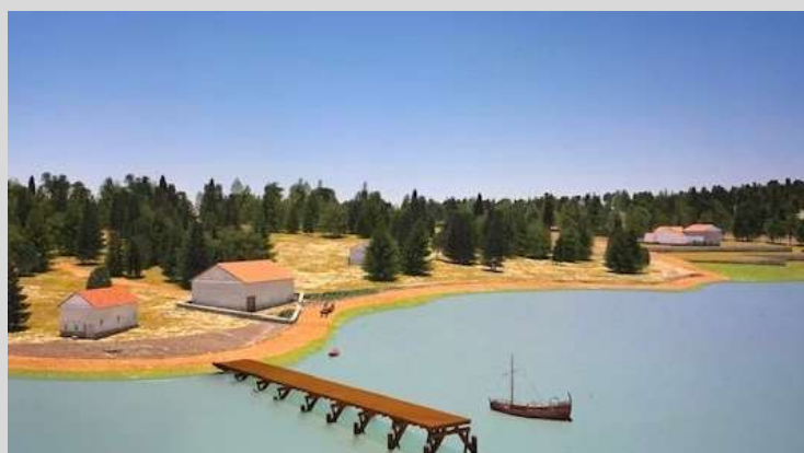
La villa et son port vu de la ria