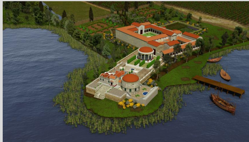
Le domaine de Vénus bientôt ouvert aux visiteurs...